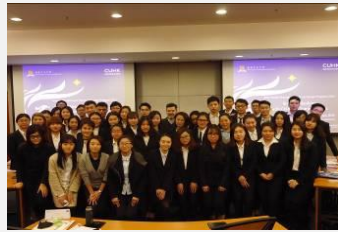
影响力与谈判技巧