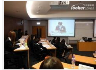
七国集团及金砖四国